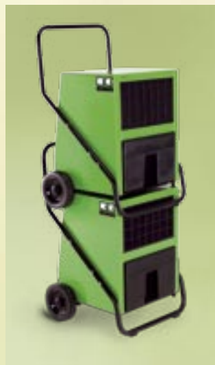
REMKO Luftentfeuchter sind stapelbar

Die fahrbaren Luftentfeuchter REMKO AMT sind leicht zu bedienen und garantieren störungsfreien Dauereinsatz rund um die Uhr.