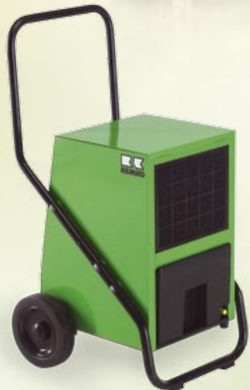
REMKO AMT 40-E