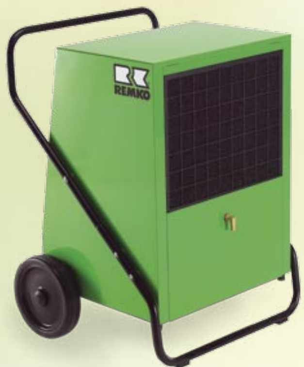
REMKO AMT 110-E