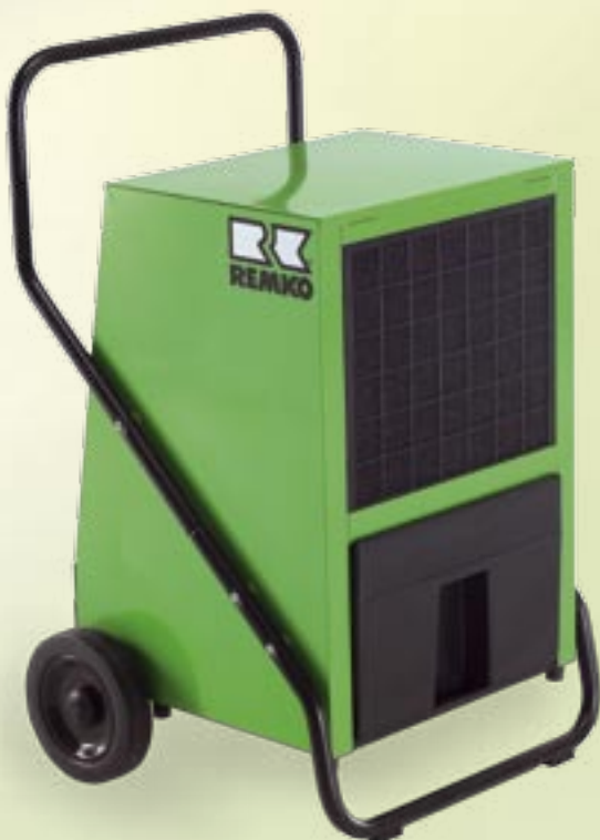
REMKO AMT 80-E