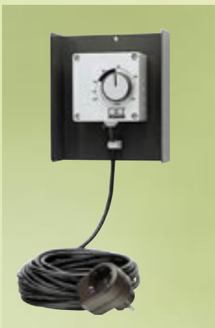
REMKO Raumhygrostat zur vollautomatischen Steuerung, steckerfertig

REMKO Luftentfeuchter eignen sich hervorragend zur wirtschaftlichen Raumtrocknung im Keller und Trockenkeller, Hobbyraum, Wintergarten, Bad, Werkraum, Freizeitraum, Archiv, Lager etc.